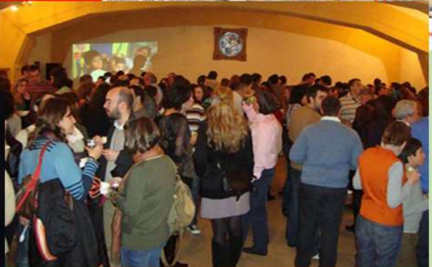
Fiesta de APROEDI