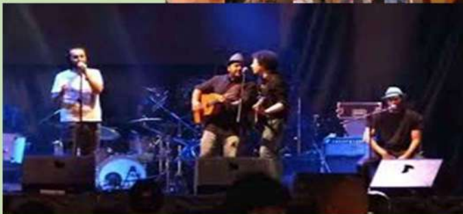
Jarana y evento musicales